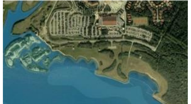
Kabellaarsbank, naast Port Zelande

Over het plan Brouwerseiland loopt er momenteel een rechtszaak van onder andere de Zeeuwse Milieufederatie bij de afdeling rechtspraak van de Raad van State. Tijdens een zitting die twee dagen in beslag nam, betoogde de milieufederatie onder meer dat het Brouwerseiland op een verkeerde plek ligt, slecht is voor de natuur en helemaal niet zo bijzonder is als wordt voorgespiegeld, zo staat in de Provinciale Zeeuwse Krant van 26 september te lezen. De Raad van State was ook erg kritisch over het plan en ging onder meer in op de beoogde locatie. De Brouwersdam is immers een zeekering, en het ministerie mag alleen toestemming geven om daar te bouwen als een project 'innovatief' is en er een 'groot maatschappelijk belang' mee is gediend. Woordvoerders van het ministerie en van Brouwerseiland hadden op de zitting moeite om duidelijk te maken waarom het project zo bijzonder en vernieuwend is.