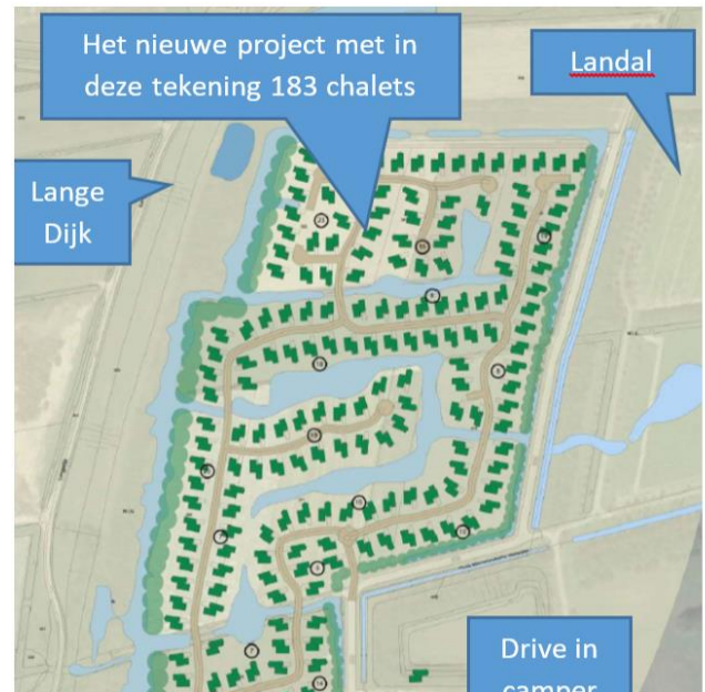
Plattegrond van de ontwikkeling langs de Lange Dijk zoals de ontwikkelaar die heeft ingediend.

5. Verplaatsingsgebied Lange Dijk Een deel van het oorspronkelijke Verplaatsingsgebied is nog niet ingevuld en heeft nu nog een agrarische bestemming. Wel is er een wijzigingsbevoegdheid van het college van B&W om het gebied in te vullen met verblijfsrecreatie, onder voorwaarde van verplaatsing van eenheden uit het zandwallengebied. Er is een verzoek ingediend om invulling te geven aan deze wijzigingsbevoegdheid. Deze is afgewezen in afwachting van de uitwerking van de recreatievisie.